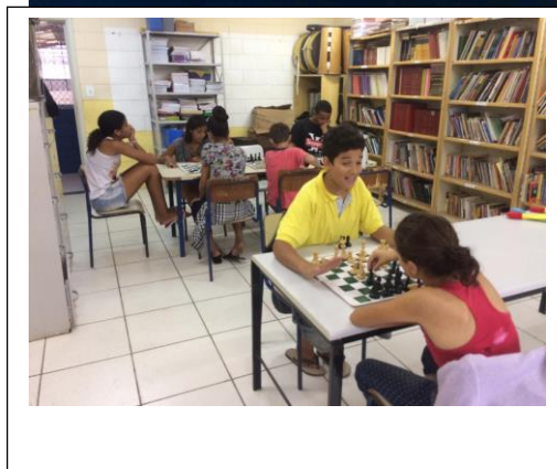
PROFESSOR DA MODALIDADE DE XADREZ E DAMAS MINISTRANDO AULAS NO OTHONIEL E JOSÉ VENEZA MONTEIRO