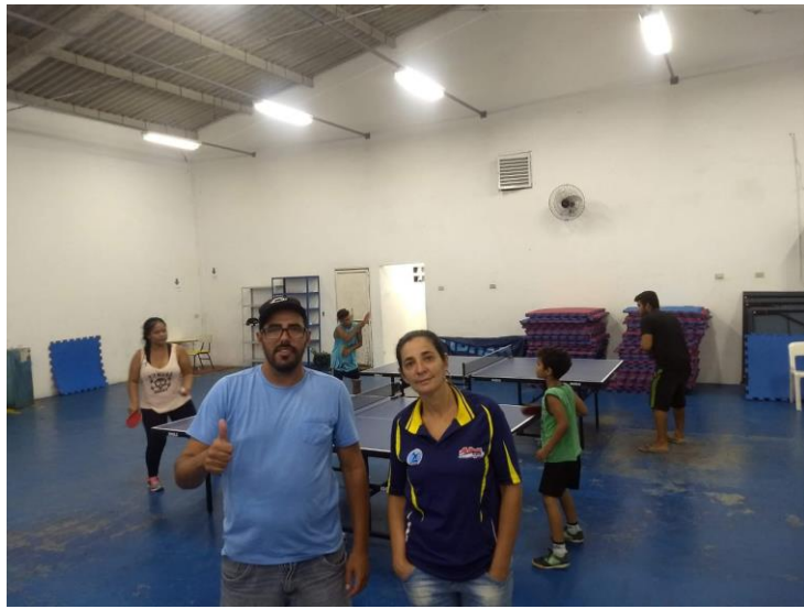
TÊNIS DE MESA: PÓLO DO COMPLEXO ESPORTIVO JARDIM BRASIL